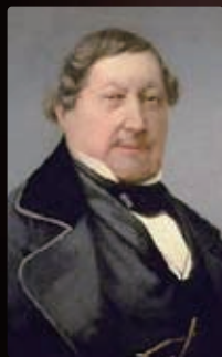
生涯に50作近くものオペラを作曲したイタリアの巨匠。“ロッシーニ風ステーキ”のレシビを生んだ美食家としても有名。 ジョアキーノ・ロッシーニ (1792-1868)

はずむように軽やかな音楽にのせて、魅力あふれる登場人物たちが生き生きと動き回る「セビリャの理髪師」。初演から200年近く経つ今もお色あせないみずみずしさに満ちた本作は、理髪師フィガロの早口も痛快な「私は町の何でも屋」(第1幕)、ロジーナの声がコロコロと軽やかに転がる「今の歌声は」(第1幕)、オーケストラが嵐の様子を描く「嵐の音楽」など、観どころ聴きどころが満載の傑作オペラです。心ときめく美しい音楽に、お腹いっぱいのユーモアと、あふれんばかりの幸福感…。イタリアオペラの妙味がたっぷりつままったこの作品を、毎夏話題のオペラシリーズを手掛けてきたマエストロ佐渡裕が、ロッシーニさながらに!? 大胆に料理。「字幕を見なくても大笑いできるように」という思いを込めて、楽しさ直球ストレートの日本語上演でお届けします!