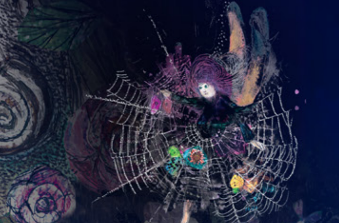
—— 今回の舞台美術プランより ——

一瞬で見るものを夢の世界へ誘う、子ども達による愛らしい妖精の合唱。カウンターテナーが演じる妖精王オーベロンの甘美なアリア、繊細なオーケストレーションなど、全編がファンタジックな美しい旋律に彩られたオペラ「夏の夜の夢」。 ブrittenをこよなく愛する佐渡裕 の魔法のタクトが、あなたを夢の世界へお連れします!