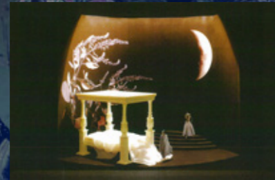
花の咲き乱れるティターニアの寝床