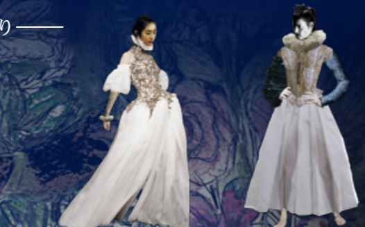
エリザベス調と和の要素をミックスした妖精の衣裳

シェイクスピアの名作「夏の夜の夢」が ファンタジックなオペラになった! 夢の世界へお連れするのは、我らがマエストロ佐渡裕。 今宵、音の魔法が降り注ぐ!