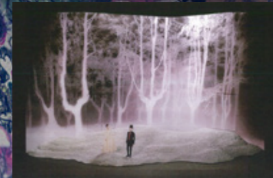
霧の立ち込める森をイメージした舞台装置