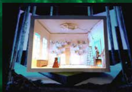
舞台模型 アガーテの部屋

set model photo : design by Friedrich Despalmes