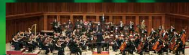
兵庫芸術文化センター管弦楽団 Hyogo Performing Arts Center Orchestra