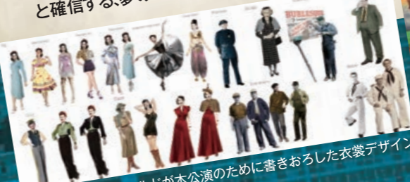
アントニー・マクドナルドが本公演のために書きおろした衣裳デザイン画、装置模型 Set and costume design by Antony McDonald

キャストは舞台芸術とミュージカルの聖地ロンドンで大規模なオーディションを行い選出! 主要な役には、英国ロイヤル・オペラやイングリッシュ・ナショナル・オペラ等で活躍するオペラ歌手を中心に、 歌唱力も身体能力も高い達者な歌手 が揃いました。 総勢約20名のアンサンブル はロンドンのミュージカル「オペラ座の怪人」、「パリのアメリカ人」公演や、バーミンガム・ロイヤル・バレエ、イングリッシュ・ナショナル・バレエ等で活躍してきたダンサーが集結。ジャンルを超越して、佐渡裕芸術監督が「 歴史的な舞台になる 」と確信する、夢のような布陣が実現しました!