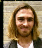
ジェyson・プラスロフ (ナビゲーター)