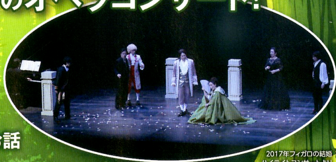
2017年フィガロの結婚 ハイライトコンサートより

ドイツオペラの魅力と美しく ロマンティックな音楽を“ええとこどり”した 「魔弾の射手」のオペラコンサート!