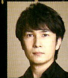
木村孝夫 (構成・演出)

2018 4/25(水)・26(木) 各日2:00PM開演 (各日1:30PM開場) 全席指定 500円(税込) 兵庫県立芸術文化センター 阪急 中ホール